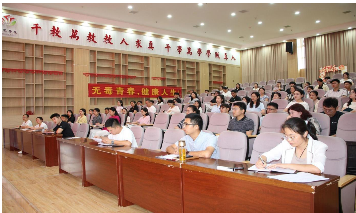
图 1-4 暑期教师培训会议