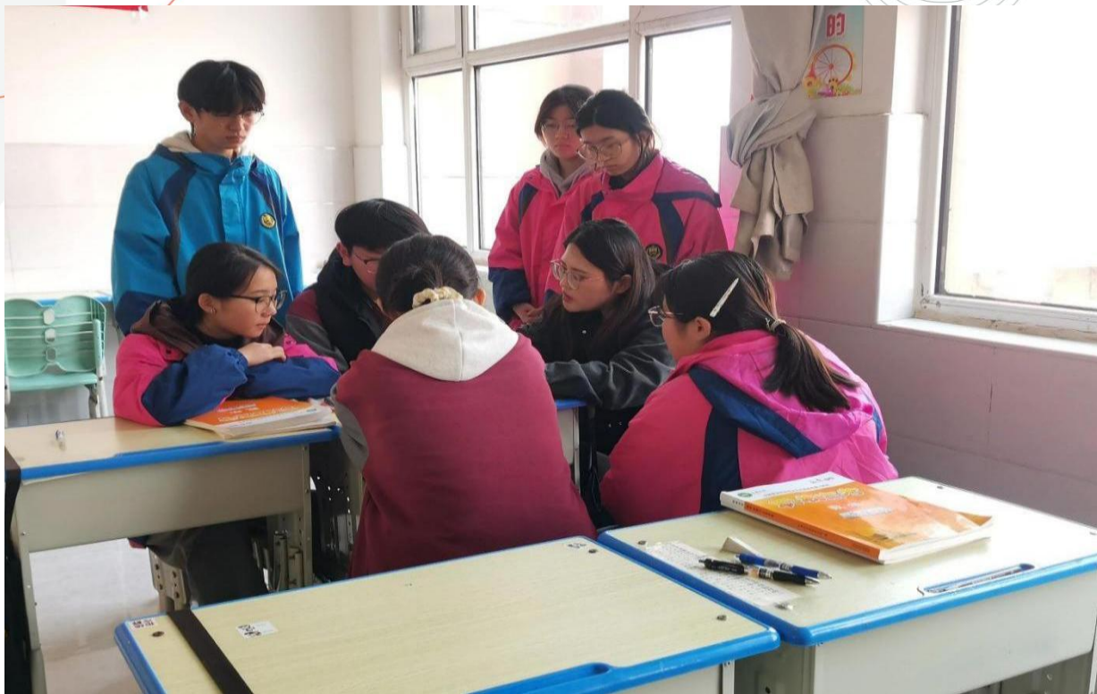
图 5-6 “三生辅导”