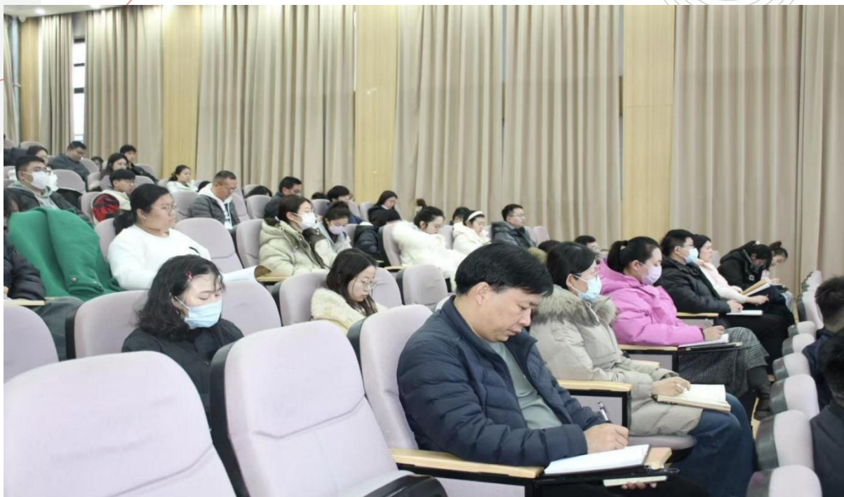
图 1-2 全体教职工大会