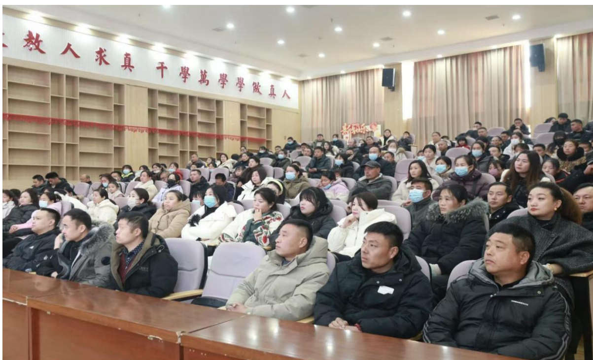
图 1-18 寒假家长会