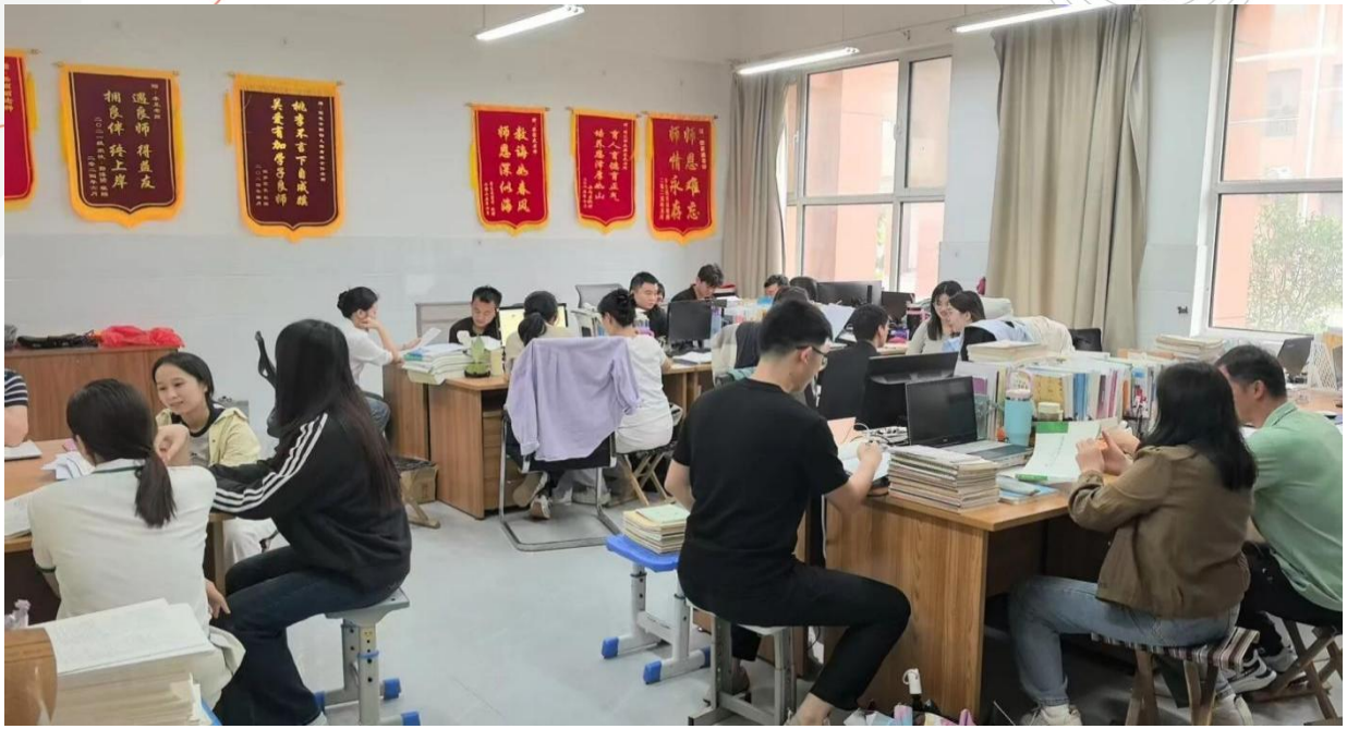
图 5-3 常态化教研活动