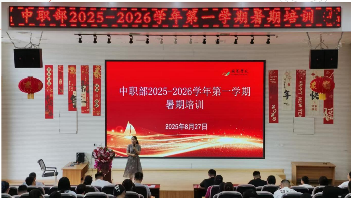
图 1-3 暑期教师培训会议