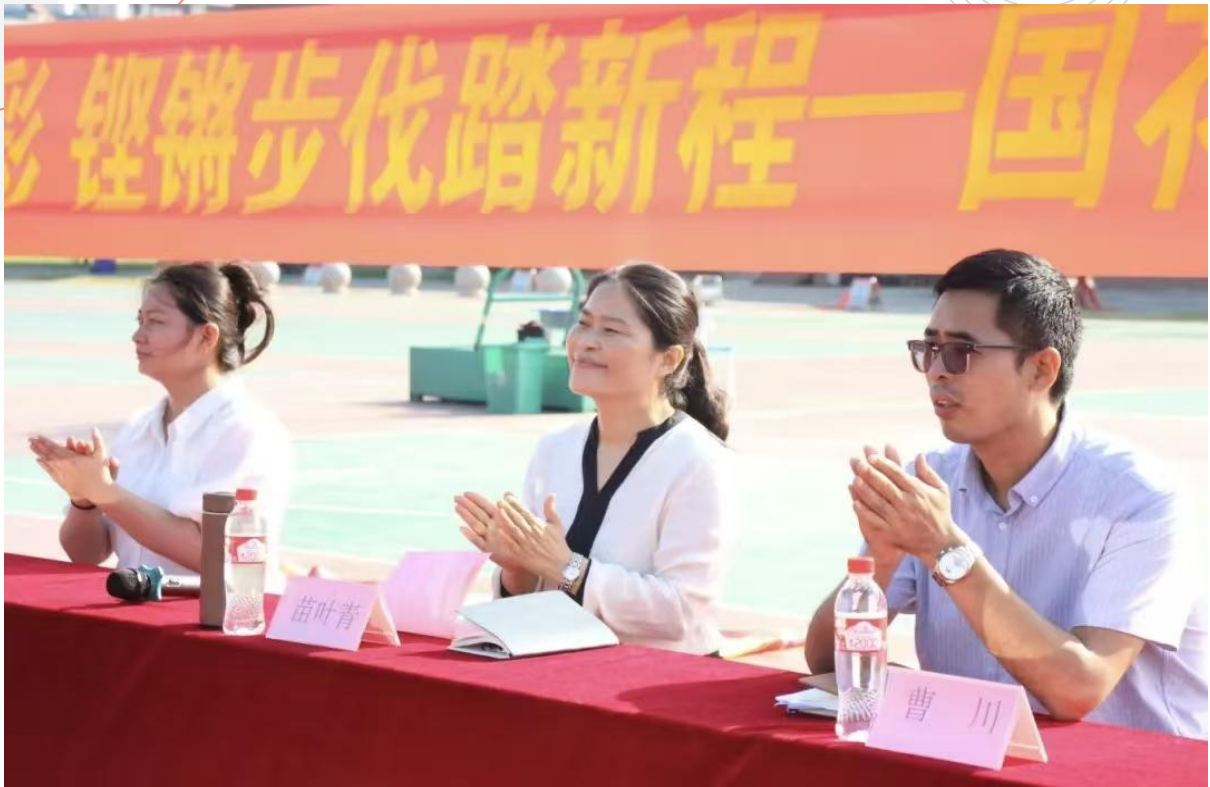
图 1-21 军训开营仪式