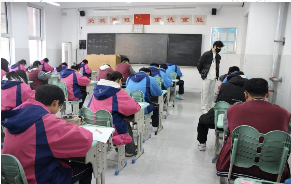
图 1-20 第一次月考纪实