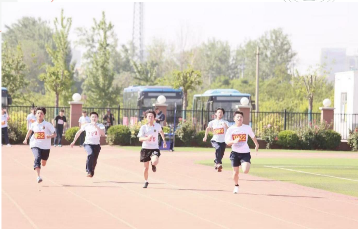
图 1-10 春季运动会