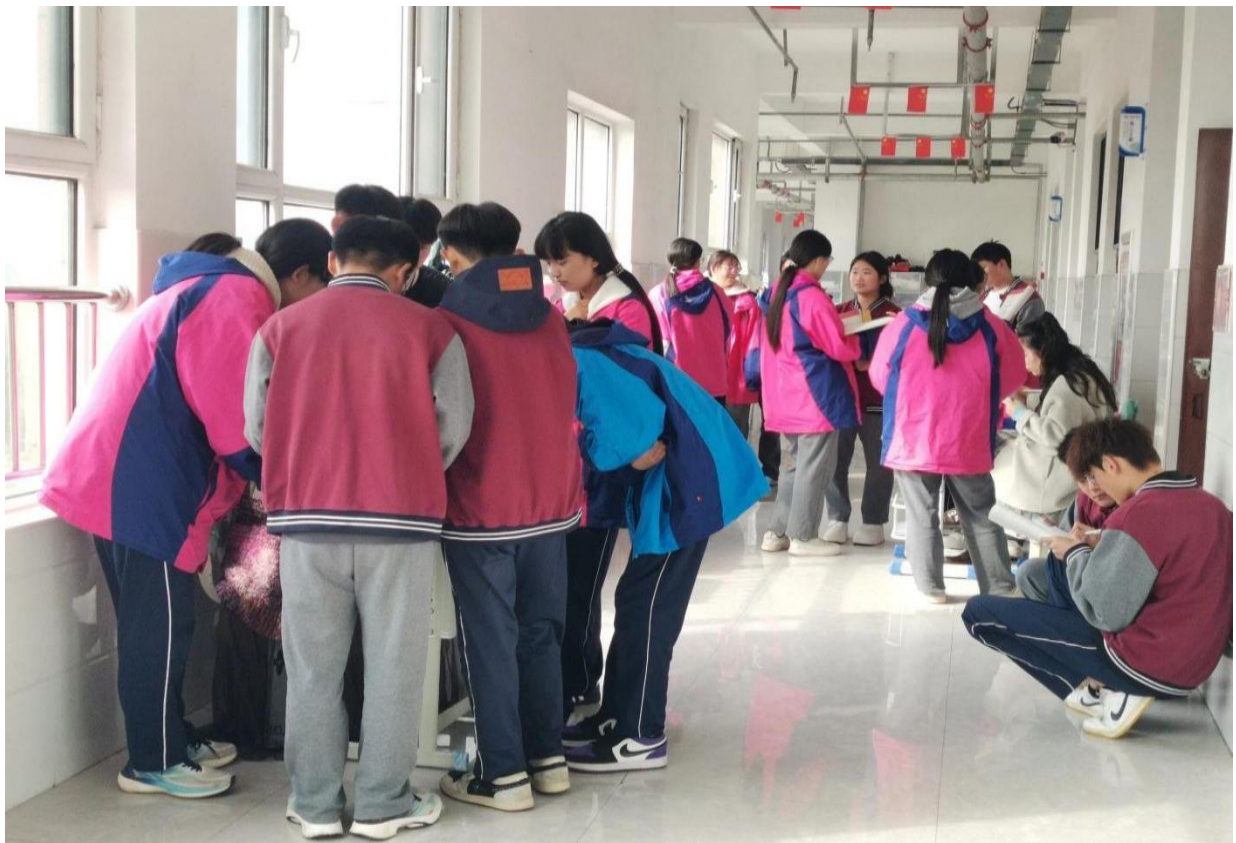
图 5-5 “三生辅导”

可复制推广： 适用于职业院校升学辅导或中小学分层教学，按“精准分层+个性化设计+常态化推进”的模式，能满足不同学生发展需求，提升升学备考针对性与实效性。