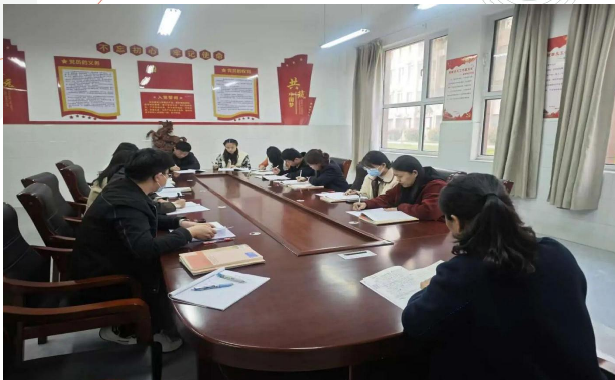
图 5-2 “新教师过关课”活动