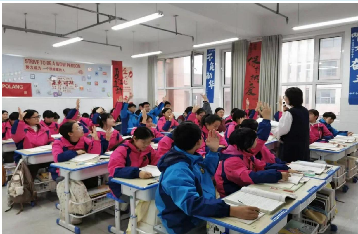
图 5-1 “新教师过关课”活动

可复制推广： 适用于学校新教师培养，按“导师引领+实践锤炼+集体研讨”的框架，能快速提升新教师教学能力，帮助其尽快站稳讲台。