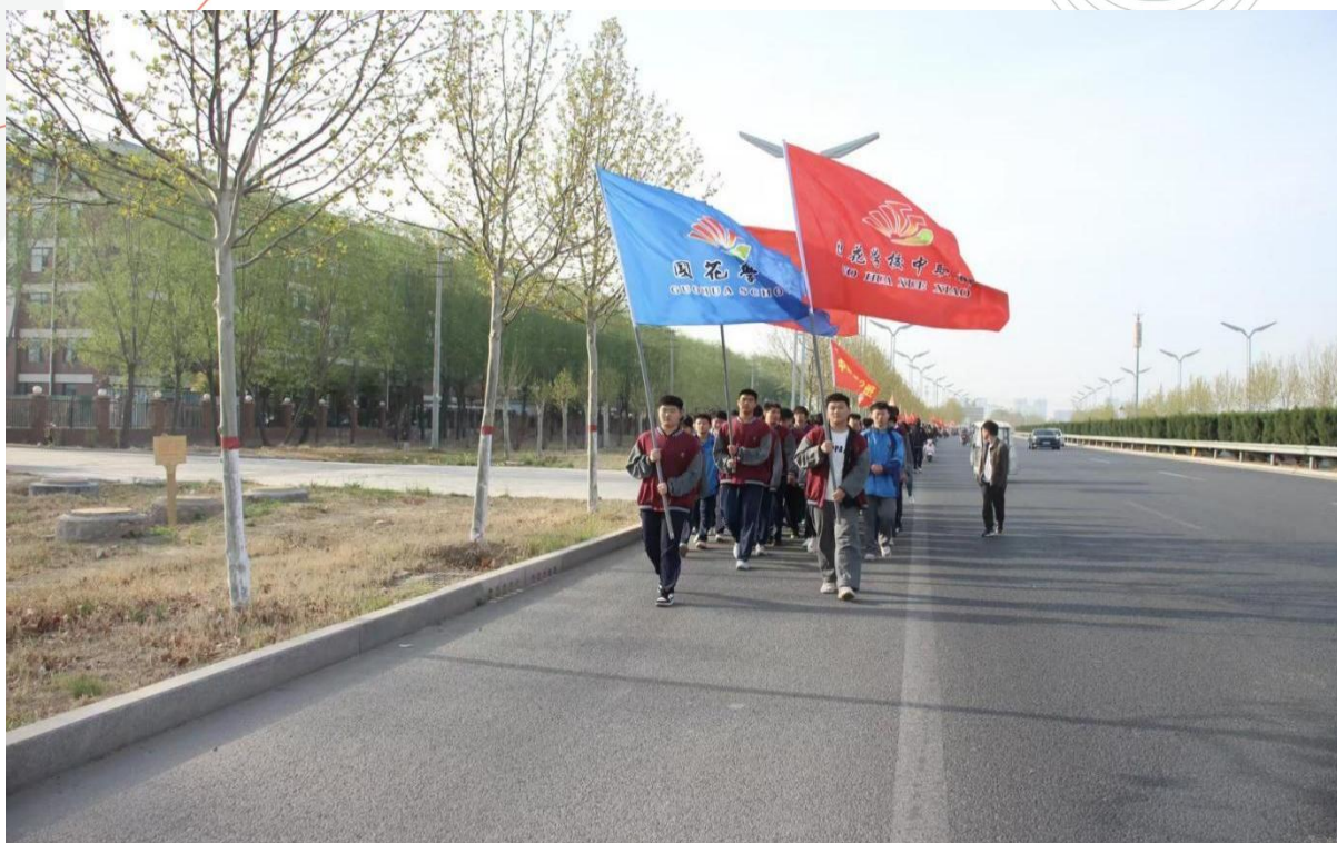
图 1-7 七里河远足拉练活动