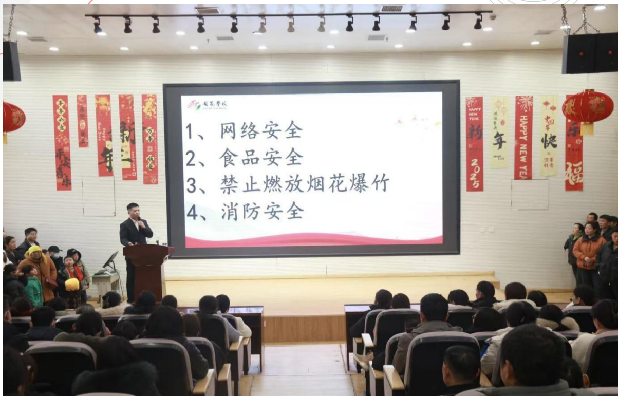
图 1-17 寒假家长会