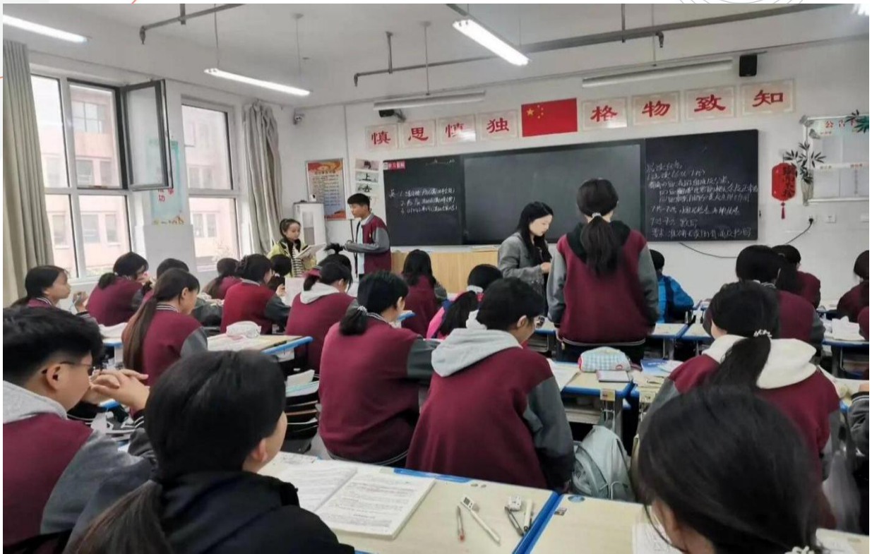
图 5-7 早晚自习落地见效