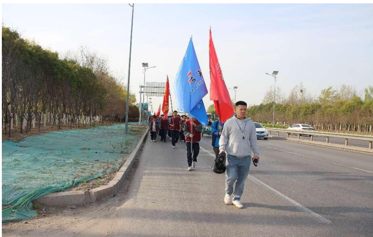
图 1-8 七里河远足拉练活动