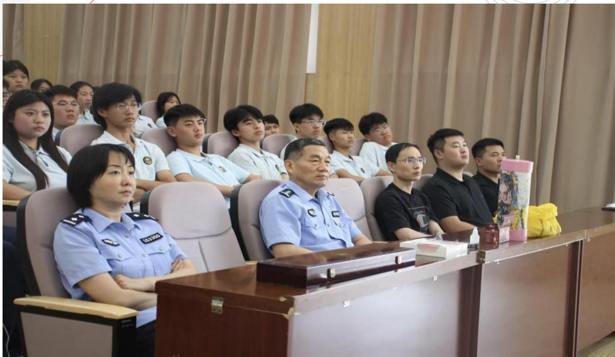
图 1-11 禁毒教育进课堂活动