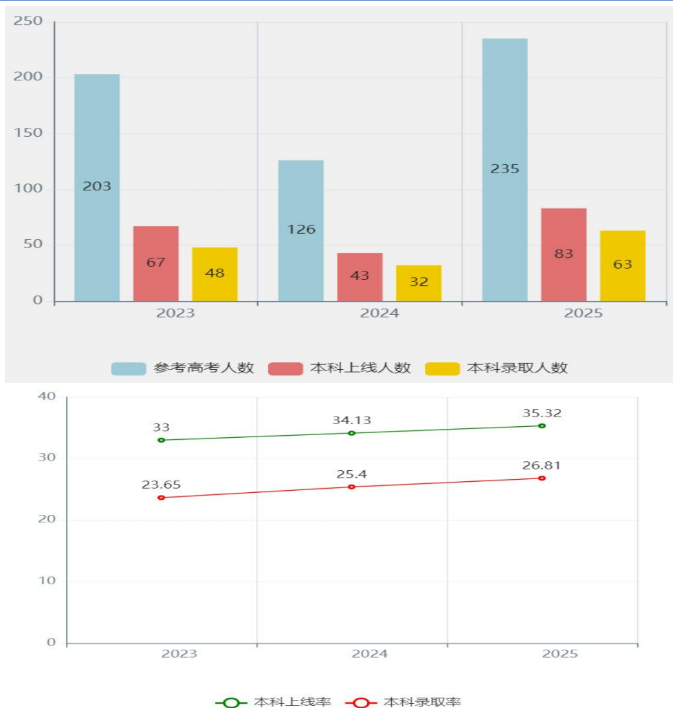
图 1-23 升学情况综合数据对比