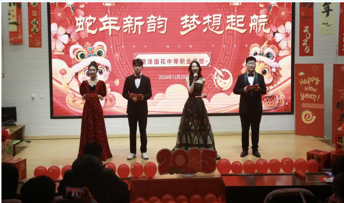
图 1-15 元旦联欢晚会

可复制推广： 适合各类院校节日庆典活动策划，通过“师生主体+内容本土化+情感共鸣”的模式，能增强师生归属感与校园文化认同感，丰富校园文化生活。