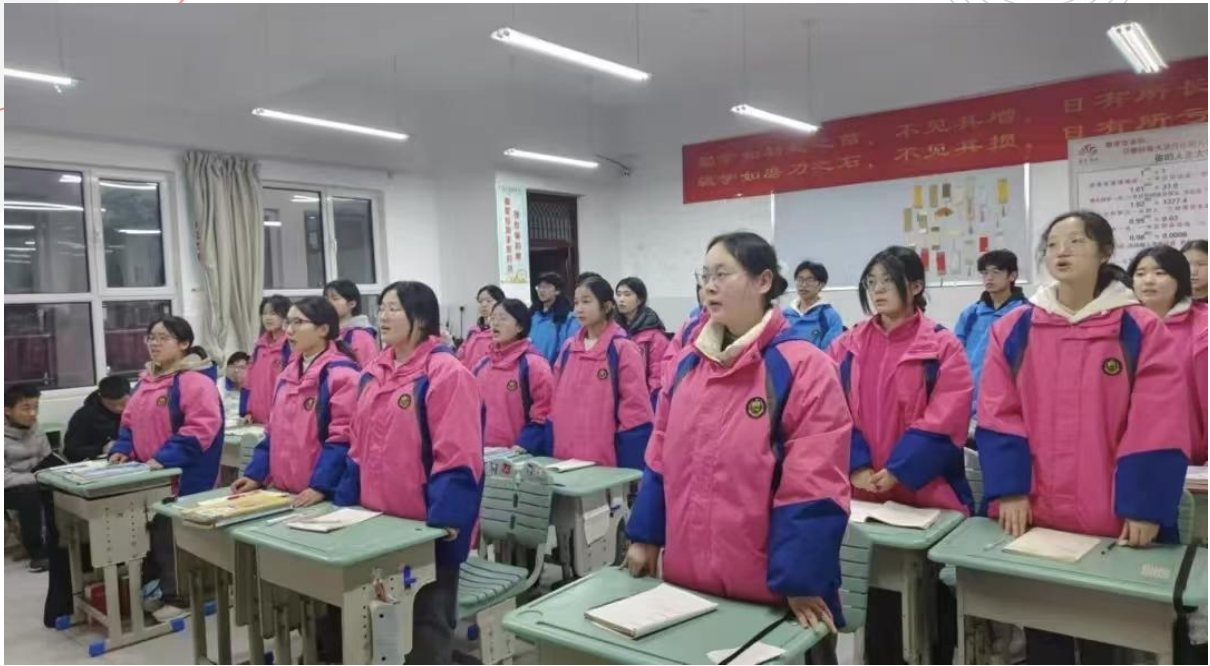
图 1-6 期末复习主题班会