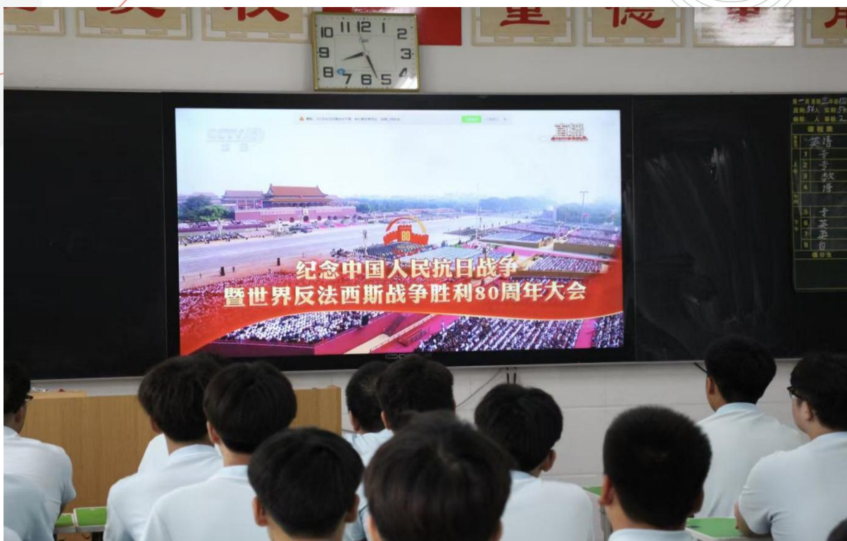
图 3-2 组织师生观看“九三”阅兵仪式