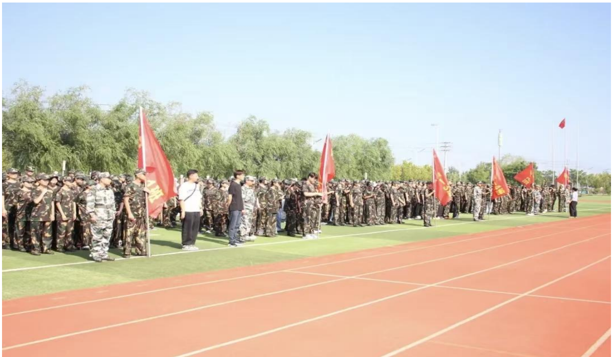
图 1-22 军训开营仪式