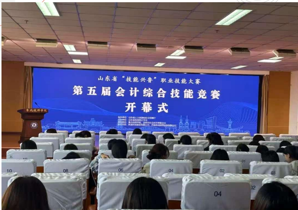
图 1-13 “技能兴鲁”职业技能大赛