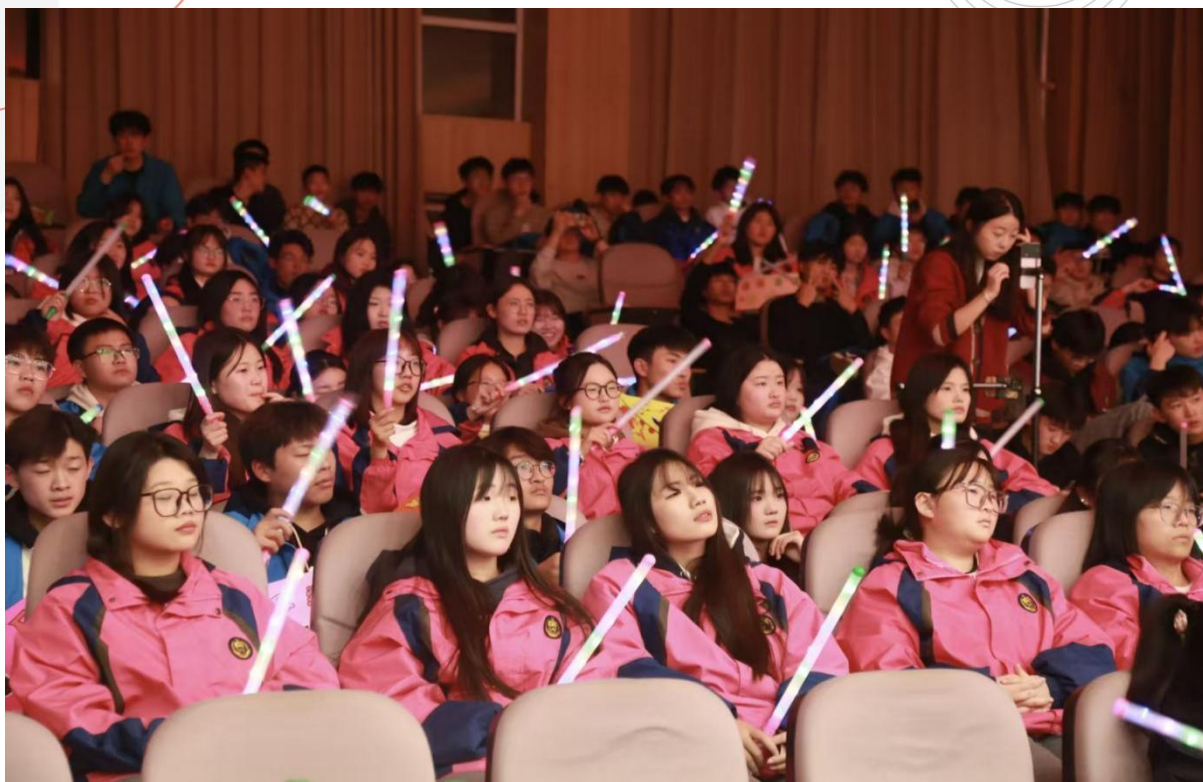
图 1-16 元旦联欢晚会