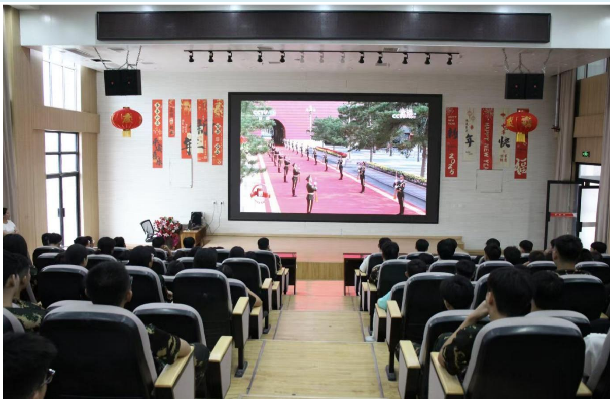
图 3-1 组织师生观看“九三”阅兵仪式

可复制推广： 适合各类院校开展爱国主义教育，通过“重大节点+沉浸式体验+互动分享”的模式，能增强思政教育感染力，引导学生铭记历史、砥砺前行。