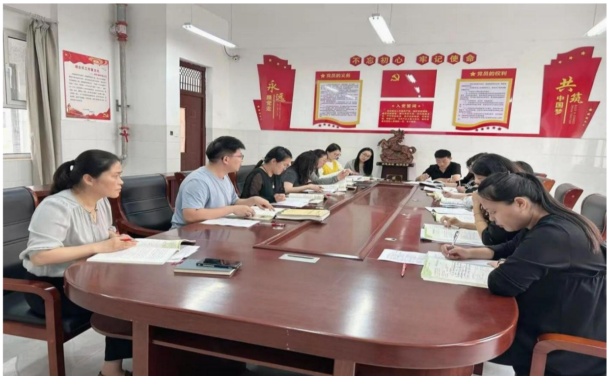
图 5-4 常态化教研活动