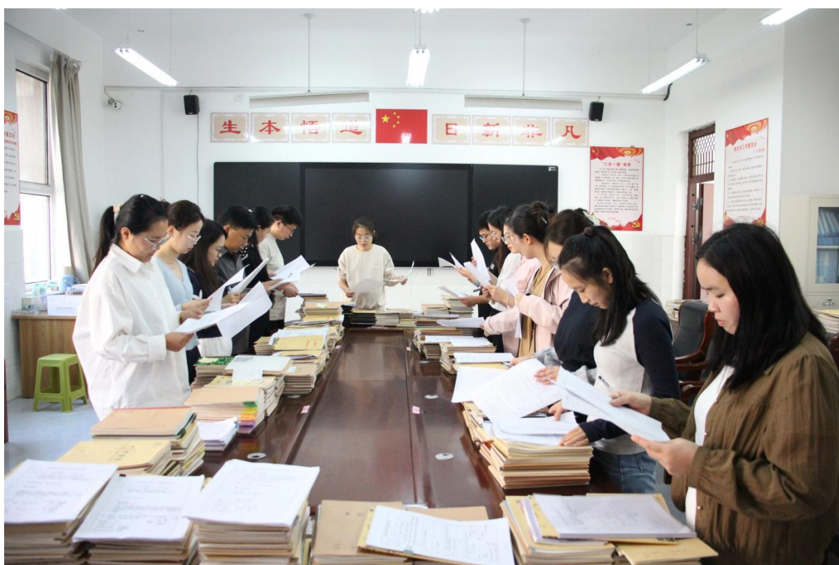
图 5-9 教学常规专项检查工作

可复制推广： 适用于各级学校教学质量管控，按“核心环节聚焦+标准细化+常态推进”框架，能稳固教学根基，提升质量管控实效。