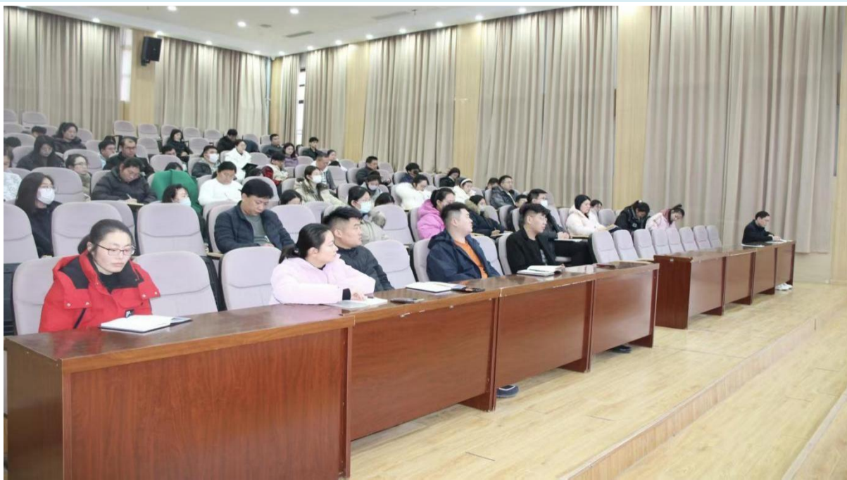
图 1-1 全体教职工大会

可复制推广： 该模式适用于各类院校学期初、中期的工作统筹，通过“核心导向+全员参与+协同推进”的思路，能快速整合校内资源，推动党建与教育教学深度融合，提升办学治校整体效能。