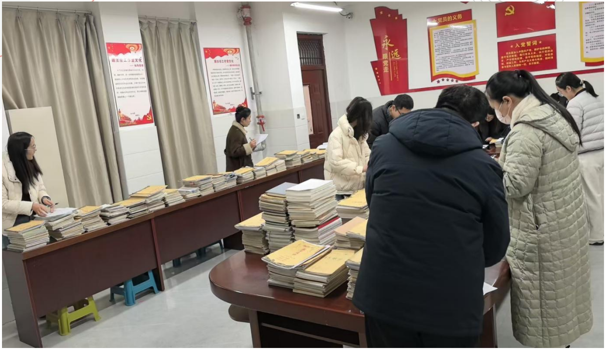
图 5-10 教学常规专项检查工作