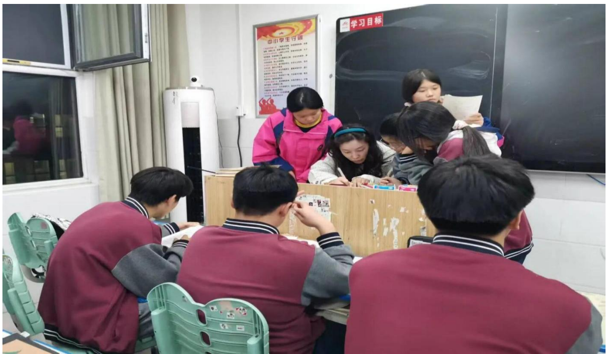
图 5-8 早晚自习落地见效