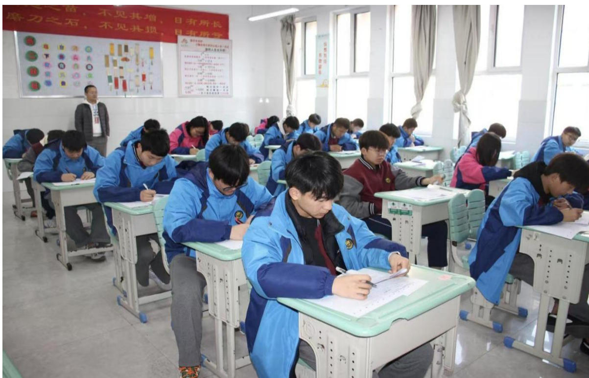
图 1-19 第一次月考纪实

可复制推广： 适合各级学校阶段性教学质量检测，按“规范组织+数据驱动+精准改进”的框架，能及时掌握教学效果，为后续教学精准施策提供科学依据。