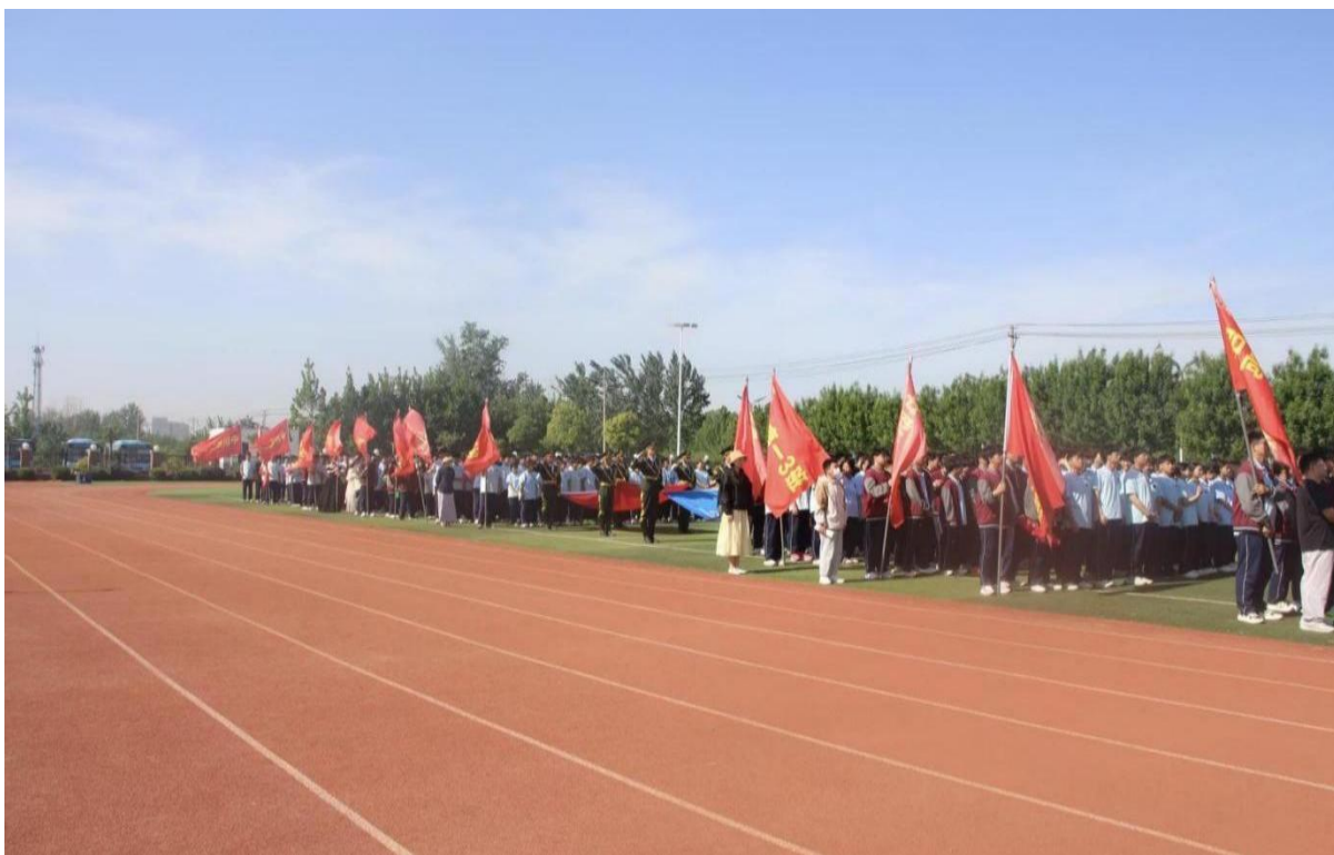
图 1-9 春季运动会

可复制推广： 适用于各类院校体育节、运动会策划，通过“竞技与展示并重+全员覆盖+文化融入”的模式，能充分发挥体育育人功能，增强师生凝聚力与校园活力。