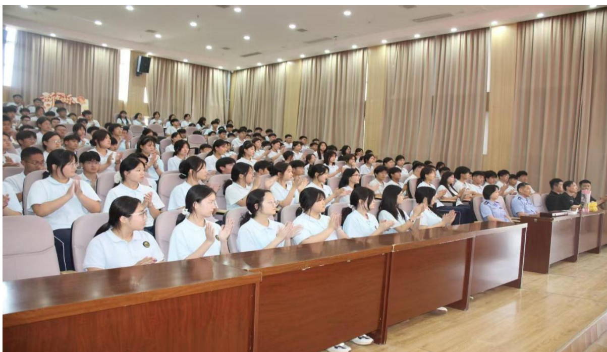
图 1-12 禁毒教育进课堂活动