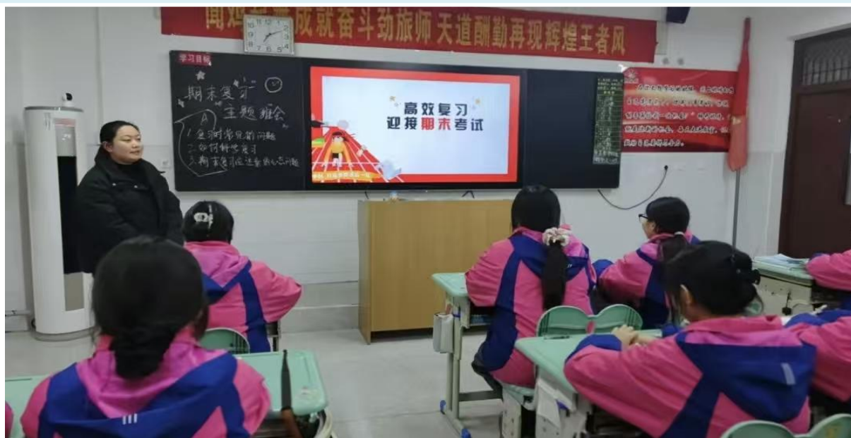
图 1-5 期末复习主题班会

可复制推广： 适用于各级各类学校期末复习阶段，通过“示范引领+精准施策+身心兼顾”的模式，能帮助学生明确复习方向，提升备考效率，同时减轻教师备考压力。